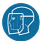
Helm met gelaatscherm of soortgelijke