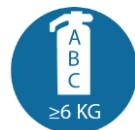
Brandblusser (klasse A/B/C) van minimaal 6 kg