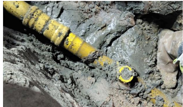
Foto: PVC leiding met niet-trekvlaste verbindingsmof

Het risico van de werkzaamheden was onvoldoende bekend bij de monteur en opdrachtnemer. Zo is er niet bij stilgestaan dat het stootijzer kon kantelen. Verder vond er geen toezicht plaats.