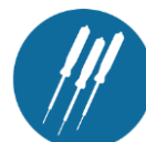
Kortsluitvast beveiligde meetpennen