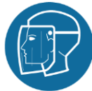
Helm met gelaatscherm of soortgelijke