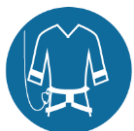
Verticaal valbeveiligingssysteem bij klimmen boven 2,5m