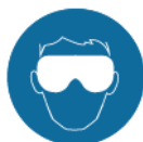
Bij onder druk verwisselen van de hoofdkraan: veiligheidsbril