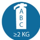
Brandblusser (klasse A/B/C) van minimaal 2 kg