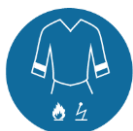
Antistatische en vlamvertragende werkkleding