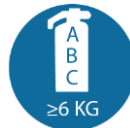
Brandblusser (klasse A/B/C) van minimaal 6 kg