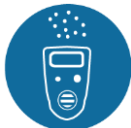
Gassignaleringsapparatuur, geschikt voor detectie van LEL, H 2 S en O 2 , met akoestisch en optisch signaal