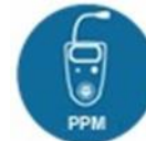
H 2 S concentratiemeetapparatuur meetbereik 0 -2000 ppm voor werkplek bescherming